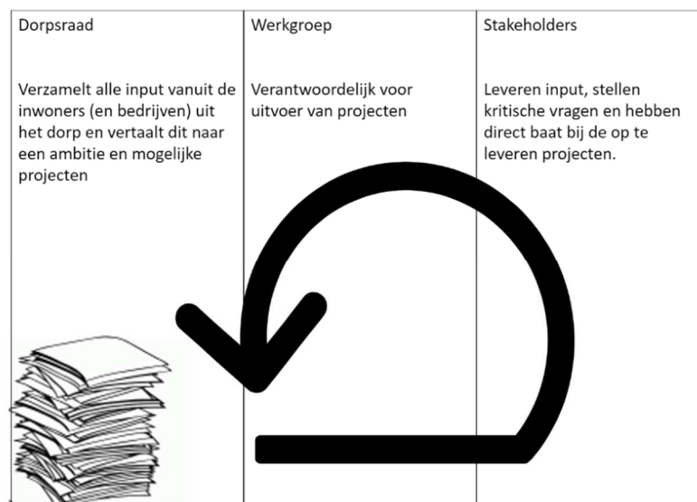
Figuur 1 Werkwijze DAP-aanpak

Periodiek is er overleg tussen de dorpsraad en de kartrekkers van de werkgroepen om de onderlinge samenhang niet uit het oog te verliezen en om de voortgang te bespreken. De werkgroepen zelf hebben een grote mate van eigen verantwoordelijkheid binnen de gestelde kaders en begroting. De projecten die door deze werkwijze geïnitieerd worden dragen in alle gevallen bij aan de gestelde ambitie.